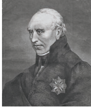
Stanisław Staszic „Kłosa”, 1875, nr 509, s. 197.

„Skupienie w tak znacznym okręgu ziemi stykających się bez przerwy różnych kruszców, i innych użytecznych rzeczy kopalnych, potrzebuje jednego ogólnego na cały kraj systematu wyrobów czyli eksploatacyj. Potrzebuje ogólnych i jednakich prawideł przepisu, podług którychby z mniejszym kosztem, a z większym użytkiem, te bogactwa z ziemi wydobywane były.”